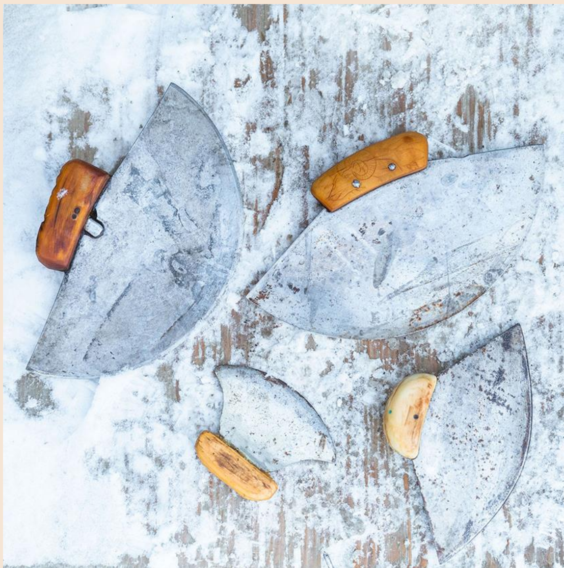
Gli utensili utilizzati dai nativi per sezionare le parti dopo la caccia

COMITATO DI REDAZIONE Roberto Fiore, Lorenzo Pispero, Matteo Riccardi, Stefano Solida